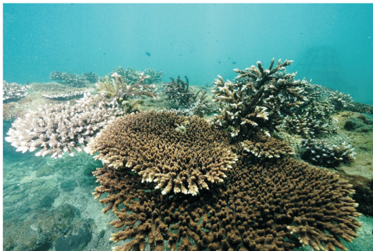
图5 涠洲岛上利用珊瑚断枝培植的鹿角珊瑚

珊瑚礁的人为修复, 理论和实践已证明其科学可行性。已开展实践且不乏成功范例的是珊瑚移植(Coral Transplantation), 即利用珊瑚无性繁殖方式实现珊瑚断枝重生并成长。相比珊瑚体上珊瑚的分枝, 珊瑚断枝生长得更快 [67] , 是增量生长。移植的珊瑚断枝成活率可以很高, 如细柱滨珊瑚( P. cylindrica )移植20个月后的成活率为80%—100% [68] 。涠洲岛珊瑚断枝培养结果显示, 一年成活率: 风信子鹿角珊瑚( A. hyacinthus )为20%—80%, 粗野鹿角珊瑚( A. humilis )为25%—49% [69] (图5)。在礁石上进行珊瑚移植, 是恢复受损珊瑚群落的良方。充足的