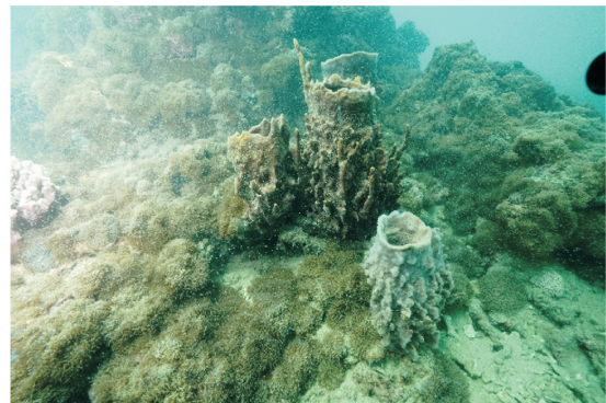
图4 涠洲岛的桶状海绵