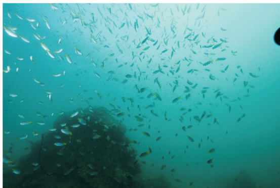
图3 涠洲岛的斑刻新雀鲷

珊瑚礁海洋生物多样性也表现出明显的退化现象。2001年来,年度珊瑚礁健康调查发现,珊瑚礁健康指标种类和数量稀少 [39] 。常见的鱼类多为斑刻新雀鲷( Neopomacentrus bankieri ) (图3)、尾斑光鳃鱼( Chromis notata )、四线天竺鲷( Apogon quadrfasciatus )、线尾锥齿鲷( Pentapus setosus )、五带豆娘鱼( Abudefduf vaigiensis )等小型鱼类;软体类有阿文绶贝( Cypraea arabica )、马蹄螺( Trochus spp.)、江珧( Atrina spp.)、密鳞牡蛎( Ostrea denselamellosa )、珍珠贝( Pteria sp.);棘皮类有方柱翼手参( Pentacta quadrangularis )、海百合( Metacrinus spp.)、玉足海参( Holothuria leucospilota )、锚参( Synapta maculata );腔肠动物有海葵、柳珊瑚、软珊瑚;多毛类有缨鳃虫;扁形动物有黄点海扁虫( Thysanozoon nigropapillosum );多孔动物有桶状海绵( Xestospongia muta ) (图4);被囊动物有海鞘。藻类有绿藻的总状蕨藻( Caulerpa racemosa )、红藻的珊瑚藻( Corallina sp.)和江蓠( Gracilaria sp.)以及褐藻的马尾藻( Sargassum spp.)、褐舌藻( Spatoglossum pacificum )等。经济价值颇高的花刺参( Stichopus variegatus )近乎绝迹,鳃棘鲈( Plectropomus spp.)、九棘鲈( Cephalopholis spp.)、裸胸鳝( Gymnothorax spp.)等名贵海产数量锐减,鹦嘴鱼(Scaridae科和Labridae科中鱼类)难得一见。这些变化既是珊瑚礁退化的相伴现象,也是过度捕捞的必然结果。作为鱼类庇护所的珊瑚和其他资源的丧失,极可能造成若干珊瑚鱼类衰竭,它们或以珊瑚组织为食,或钟爱在珊瑚中繁衍,或与活珊瑚生死相依。