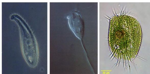
侧口类 Pleurostomatids 盾纤类 Scuticociliatids 游仆类 Euplotids