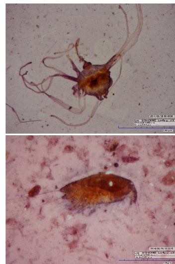
图 4 镜检下的后生动物幼体照片