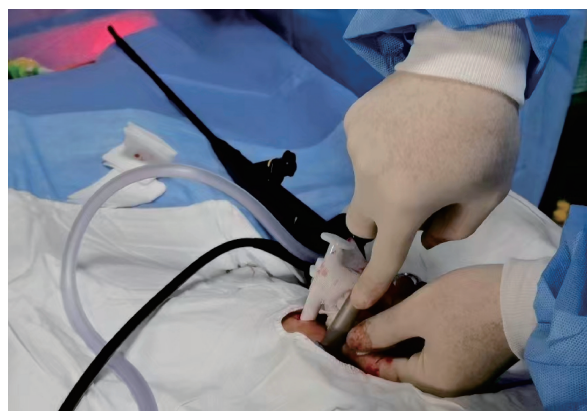
图 1 胸壁置入双穿刺鞘管

② 硬质活检钳活检。根据软质胸腔镜观察所确定的位置,按以上方法麻醉和切开胸膜皮肤,将硬质穿刺鞘管导入胸腔,助手将软质胸腔镜调至最佳角度,引导硬质活检钳对病变胸膜活检(图 1、图 2)。