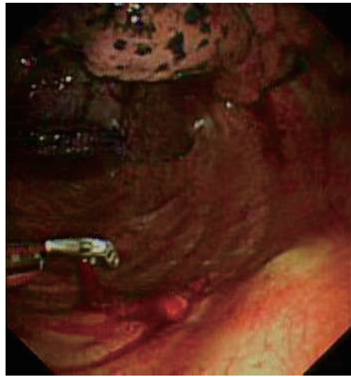
图4 对壁层胸膜活检