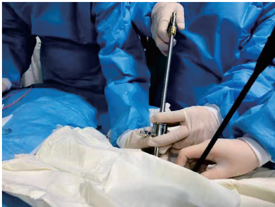
图2 双孔下软质胸腔镜联合硬质活检钳活检

Fig. 2 Double hole soft thoracoscopy combined with hard biopsy forceps were conducted for biopsy