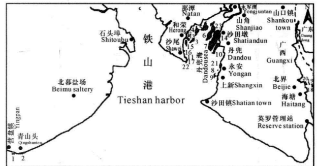
图1 广西海岸潮间带互花米草分布

调查结果表明,广西海岸潮间带互花米草现存面积为 389.2\text{hm}^2 ,主要分布于铁山港海汊丹兜海( 369.4\text{hm}^2 ,占面积比例95%),另外两个分布点分别是山口镇北界村海滩( 12.6\text{hm}^2 )和营盘镇青山头海滩( 7.2\text{hm}^2 )(详见图1)。