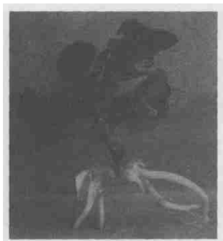
图 2 橄榄芽苗生根情况